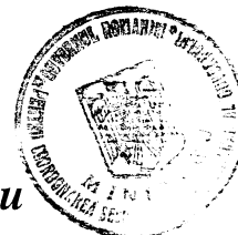
Petru Șerban Mihăilescu